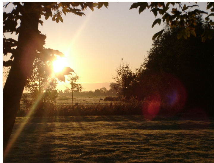
Herbst auf Nordstrand