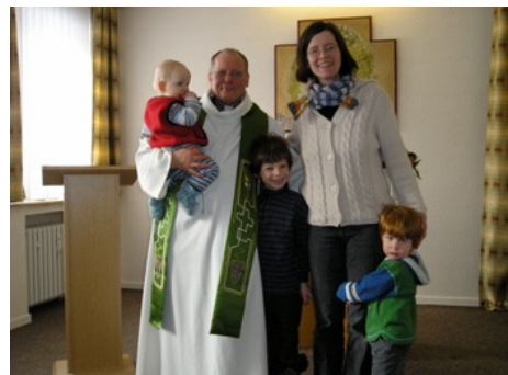
Der Neupriester und seine Familie bei der Heimat-Primiz in der Muttergemeinde Kassel

Vielen Dank allen die zum Gelingen der Feiern beigetragen und durch ihre Spenden ein sichtbares Zeichen der Solidarität gesetzt haben.