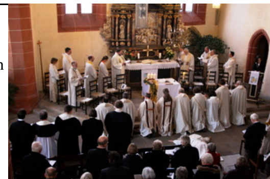
Priesterweihe in der Michaeliskirche zu Erfurt